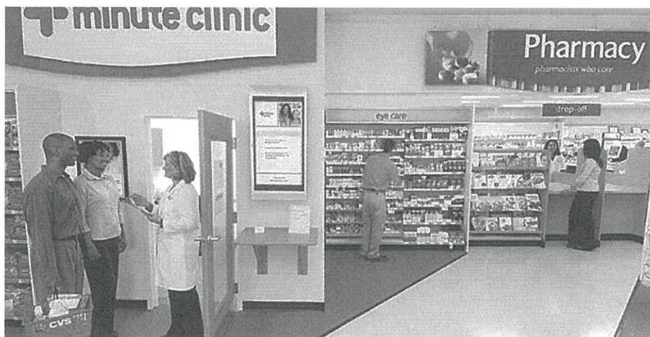
写真2 調剤コーナーの隣に併設されたミニット・クリニック