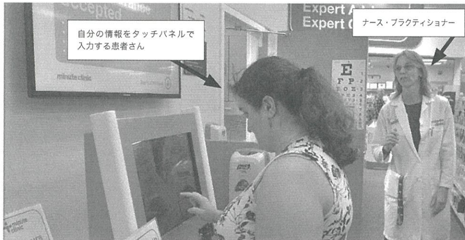
写真3 ミニット・クリニックの受診受付セルフサービス端末