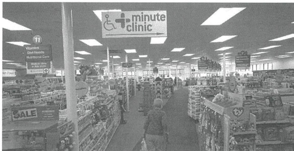
写真1 CVS 薬局内のミニット・クリニックの案内板

ボストングローブ紙 2016年3月7日号より bostonglobe.com/metro/2016/03/07/retail-medical-clinics-boost-medical-spending/0vY7XnE9TS2YqsbQD4xbO/story.htm