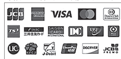
図表3 一目でわかる支払いオプション